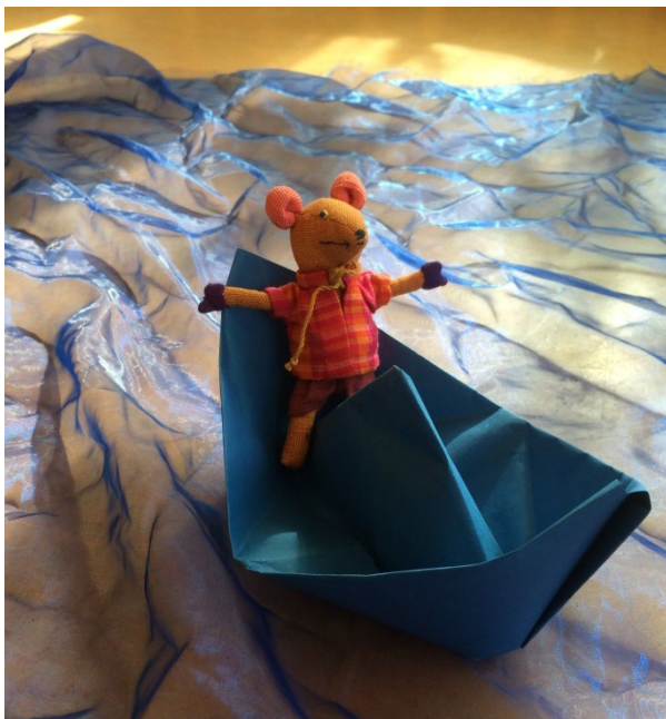
Abb. 2: Die Maus Riri auf weitem Meer.

Das Schiffchen wird wieder in die Mitte des Tuchs gestellt. Je nach Kindergartenklasse kann nun noch eine weitere Geschichte als Muster folgen, die mithilfe der Fragen gemeinsam entwickelt wird. Es kann auch direkt in eine Reflexionsphase übergeleitet werden.