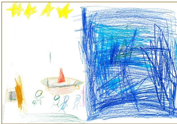
Abb. 3: Fussballplatz am wilden Meer, gezeichnet von Aamod.

Die Lehrperson geht von Kind zu Kind und sucht das Gespräch, insbesondere mit denjenigen Kindern, die bei der Entwicklung des Orts und der Geschichte noch Schwierigkeiten zeigen. Sie fragt nach mit den spezifischen Fragen zum Ort und zur Handlung. Kinder, die bereits etwas schreiben können, beschriften ihre Zeichnung. Die Zeichnung kann später beim Erzählen auch als Erinnerungsstütze dienen.