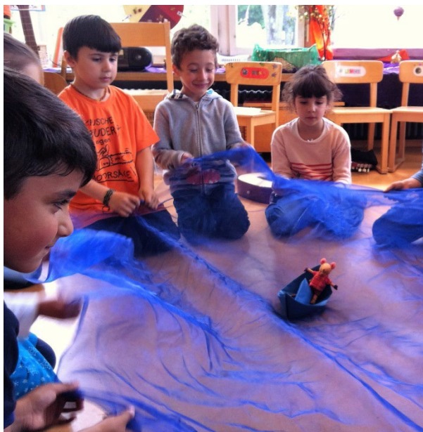
Abb.1: Der Sturm kommt auf.

Grundsätzlich kann auch eine andere Rahmengeschichte verwendet werden, die eventuell ein aktuelles Thema der Kindergartenklasse aufnimmt. Die Geschichte sollte so beschaffen sein, dass sie immer denselben Anfang und dasselbe Ende hat. So bildet sie einen festen Rahmen mit demselben Aufbau. Das folgende Beispiel soll zeigen, wie die Lehrperson ein Muster für eine solche Reihengeschichte bietet. Die Lehrperson stellt zudem Leitfragen zur Verfügung, um die Kinder in die Geschichte zu involvieren (kursiv gedruckt). Je nachdem, wie weit die Klasse ist, wird mithilfe der Antworten der Kinder die Geschichte von Riris Abenteuer gemeinsam weitererzählt. Mit dem Fernrohr kann sie jeweils die Aufmerksamkeit der Kinder auf einen bestimmten Aspekt lenken und die Geschichte verlangsamen.